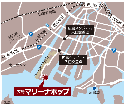
マリナーホップ内 イベントスペース 案内図